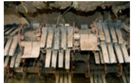
Foto 1. De Grimme FM300-ontbladeraar heeft geen kopmessen en verwijdert de laatste bladresten door intensief poetsen. Dit systeem past ook op een bunkerrooier.

In de test (zie tabel 1) werden de verschillen vooral gemaakt door de juiste instellingen voor het testperceel en attent reageren van de rooierchauffeur. Dat was duidelijk te zien bij het kopwerk. De Grimme Rootster met voorop het FM300 ontbladersysteem (foto 1) had door zijn techniek een kopverlies van slechts 1 euro per hectare. De Ropa euro-Tiger en de Vervaet Beet Eater 625 konden met goed afstellen van de scalpeurs met kopmessen de verliezen bij het koppen beperken tot 7 euro per hectare. De hoogste verliezen