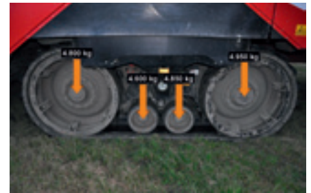
Foto 7. Het gewicht op de rupsen van de Grimme Maxtron was zeer gelijkmatig verdeeld. Van voor naar achter rustte er op de loopwielen respectievelijk 25%, 24%, 25% en 26% van het totale gewicht op de rups. In combinatie met het grote contactoppervlak van de rupsen resulteert dit in een snellere afbouw van de bodemdruk dan onder de banden van bunkerrooiers.

banden op lage bandspanning nodig zijn om dit bodemvriendelijk te houden. De Grimme Maxtron is de enige rooier op rupsen. Opvallend is hoe gelijkmatig de gewichtsverdeling is over de rollen van dit rupssysteem (foto 7). In combinatie met de relatief lagere last per loopwiel verklaart dit ook waarom de bodemdruk onder zo'n rups sneller afbouwt dan onder de banden van bietenrooiers.