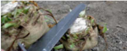
Foto 4. Te weinig ruimte voor het kopmes (bieten in dit demoveld zijn met de hand gekopt). Goed kopwerk is onmogelijk als er te weinig ruimte is tussen de bieten in een onregelmatig tweewassig gewas. Goed onderhoud van de zaaimachine en voldoende zaaiafstand (minimaal 17 cm in de rij) voorkomen dit.

Duidelijk was te zien dat alle fabrikanten bezig zijn met het verbeteren van het koppen van de bieten. Dat is ook nodig, omdat we de laatste jaren bij gezonde bieten zien dat de marge tussen te weinig en te diep koppen vermindert. De meeste kopsystemen hebben nog wel problemen met het koppen van kleine bieten tussen grote bieten (foto 3). Dat wordt nog erger als de afstand tussen de bieten kleiner is dan 17 cm bij een onregelmatig gewas, omdat dan vaak de ruimte ontbreekt voor het kopmes tussen opeenvolgende bieten (foto 4).